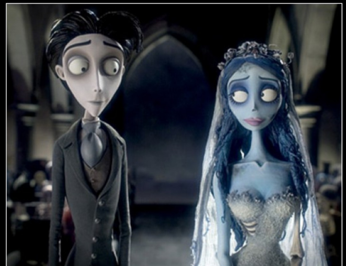
The Corpse Bride